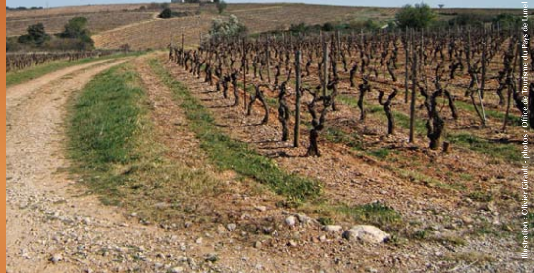
Illustration : Olivier Girault

Cette balade familiale, assez facile vous permet de découvrir le terroir de Saint-Christol à travers ses vignobles de coteaux. Ses points d'intérêt sont la vue exceptionnelle sur l'arrière-pays (Cévennes et Pic-St Loup), un bois et un domaine viticole reconnu : le Domaine de La Coste-Moynier.